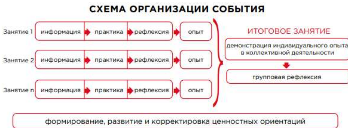
Рисунок 1 — Схема организации события

На итоговом занятии дети заполняют рефлексивные дневники, которые позволяют им зафиксировать полученный в событии опыт. Таким образом, в конце учебного года у каждого пятиклассника будет иметься собственная брошюра, иллюстрирующая его путь в Программе. По окончании всех событий проводится итоговая игра, на которой дети демонстрируют полученные в течение учебного года знания и умения, подводят коллективные и индивидуальные итоги.